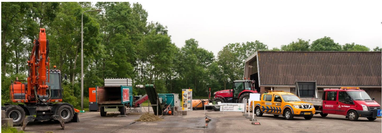
Presentatie van gras naar strooizout ism Provincie Noord Holland, TU Delft, Van Gelder en van Bodegom

Indien u goede suggesties heeft, vragen wij dit te melden aan onze CO2-functionaris Odin van Rijswijk, odin@firmajvanbodegom.nl